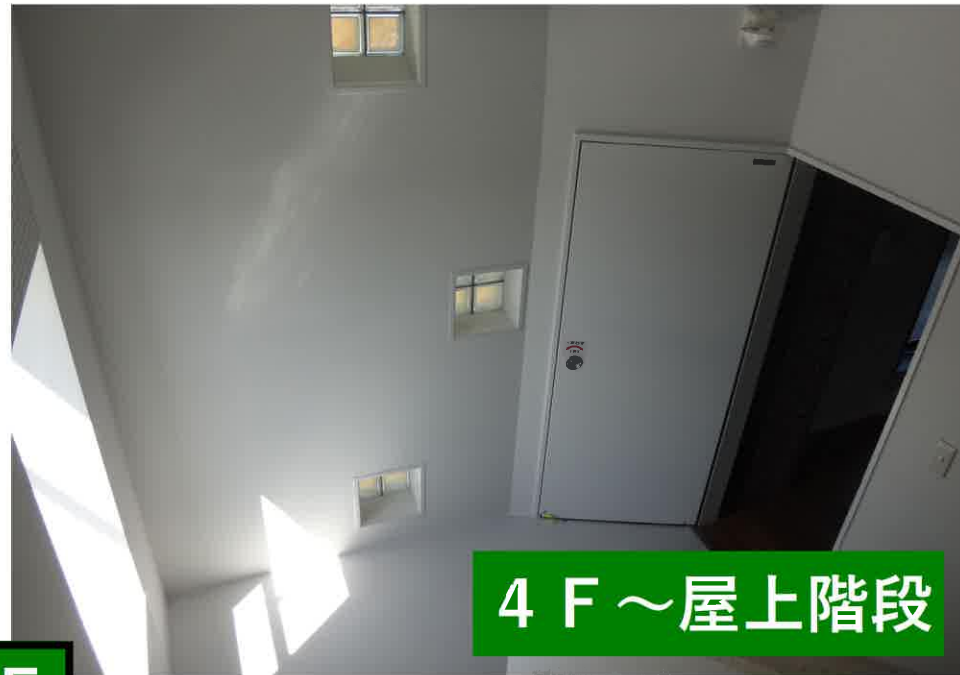
4 F ~ 屋上階段