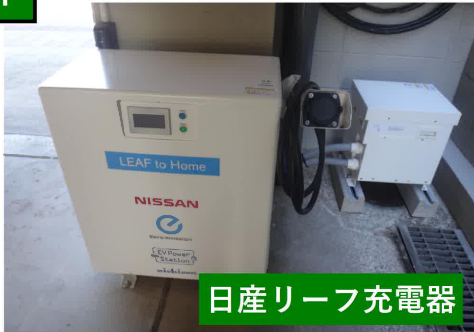
日産リーフ充電器