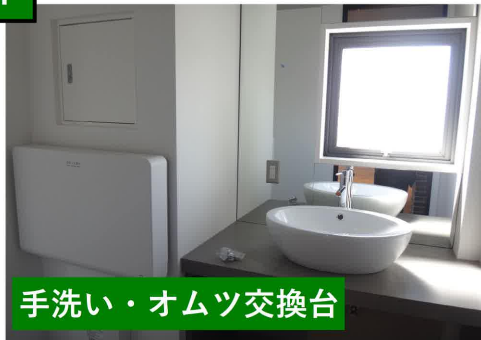
手洗い・オムツ交換台